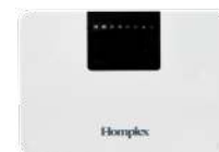
Compatibil cu centrul de comandă Homplex CC210

Produsul este în conformitate cu legislația relevantă a Uniunii Europene: 2014/35/EU, EN 60730-1:2016, EN 60730-2-9:2010, 2014/53/EU, EN 62368-1:2014+A11:2017, EN 55032:2015, EN 55035:2017, EN 61000-3-2:2014, EN 61000-3-3:2013 + A1:2019, EN 62311:2008, ETSI EN 301 489-1, ETSI EN 301 489-17, ETSI EN 300 328