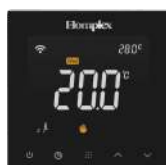
Homplex 922 Wi-Fi Black