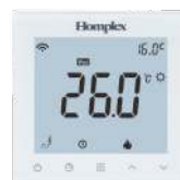
Homplex 922 Wi-Fi White