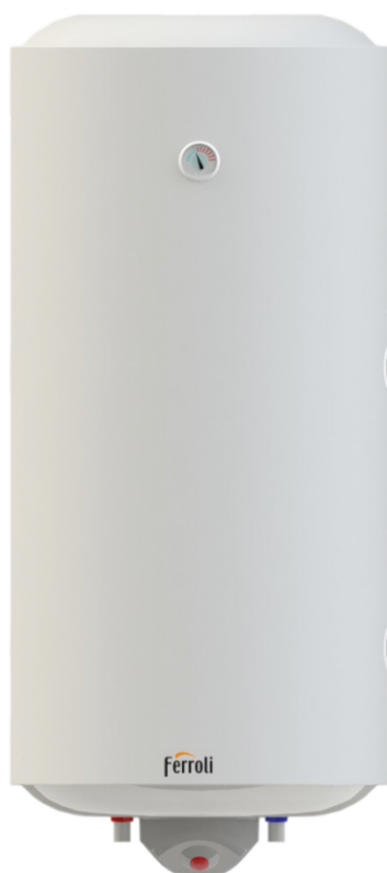
CALYPSO 200 VMT