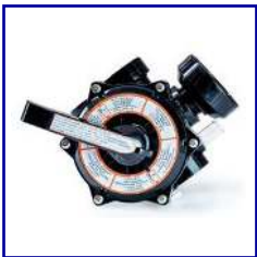
VÁLVULA DE 6 VÍAS